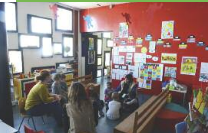
Là-haut, les petits ont des locaux hors du commun, une cour d'école qui est la plus haute de la région, avec vue imprenable sur l'agglomération ; ils profitent du terrain qui leur est attribué pour jardiner dans le parc de l'édifice.