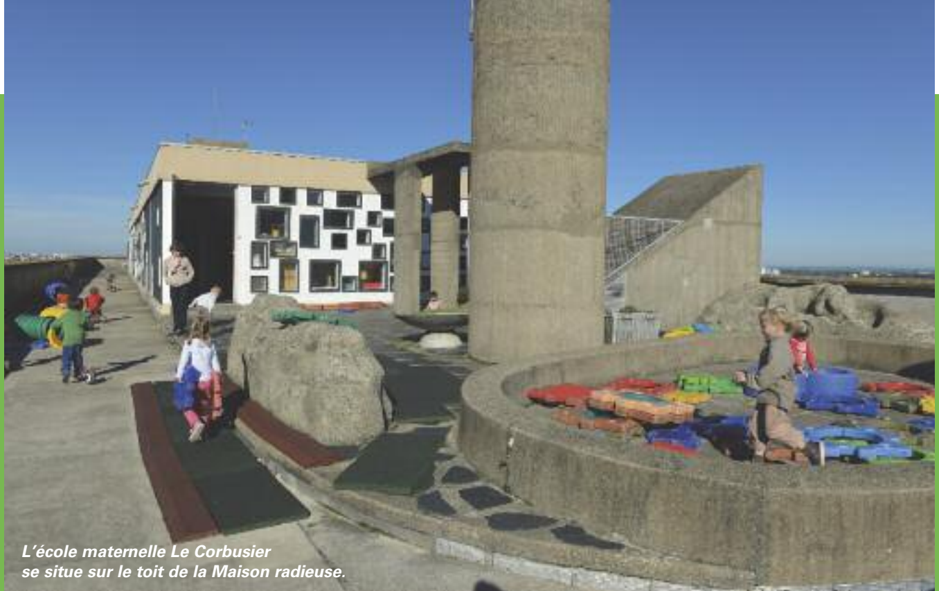
L'école maternelle Le Corbusier se situe sur le toit de la Maison radieuse.